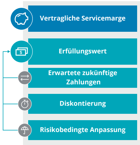
Abb. 1 – Bewertung im Zugangszeitpunkt